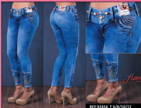
REF.92454 T 6/8/10/12