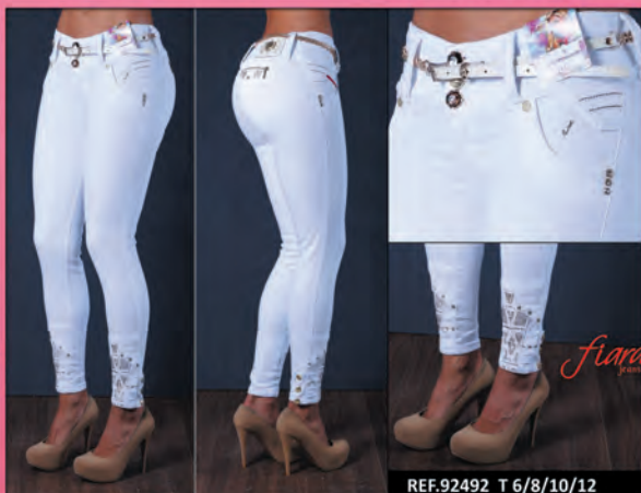
REF.92492 T 6/8/10/12