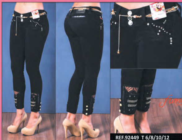
REF.92449 T 6/8/10/12