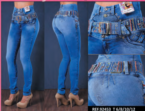
REF.92453 T 6/8/10/12