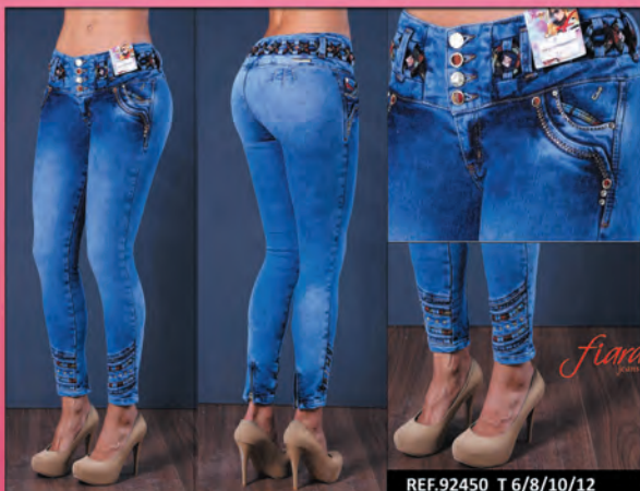
REF.92450 T 6/8/10/12