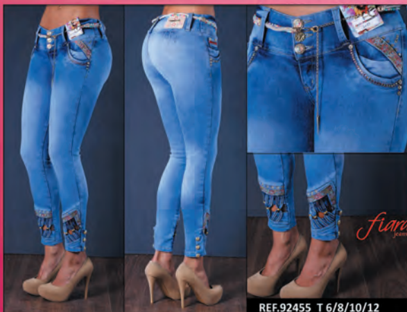
REF.92455 T 6/8/10/12