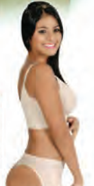
AMALIA SHORT ALZACOLA Ref.: 0319 €38