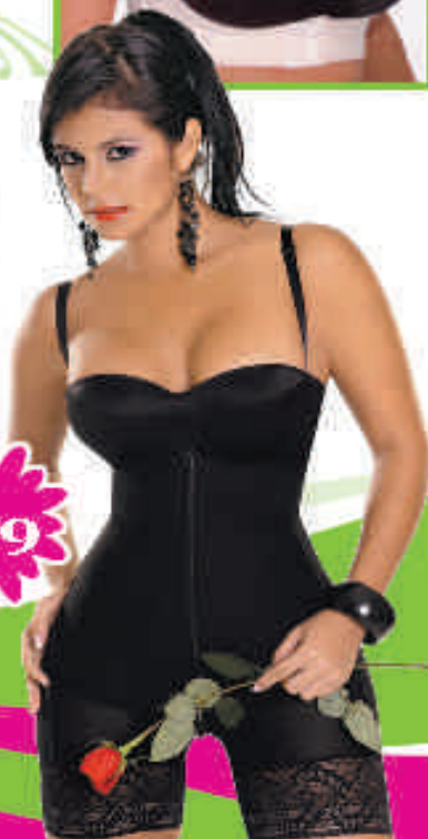
Faja Strapless short