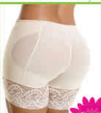
Levanta cola s/huecos