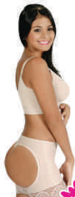
Levanta cola c/huecos