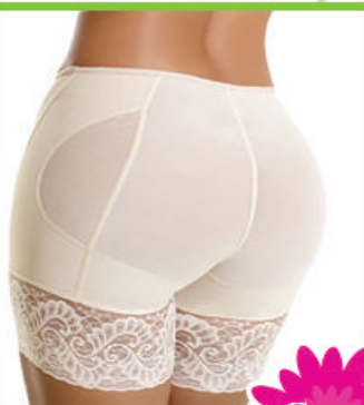
Levanta cola s/huecos