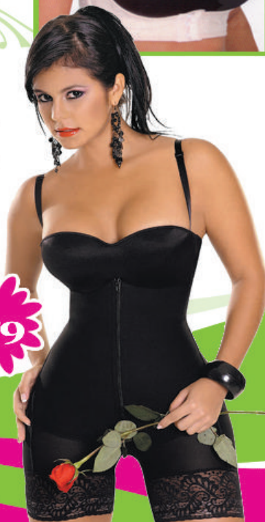
Faja Strapless short