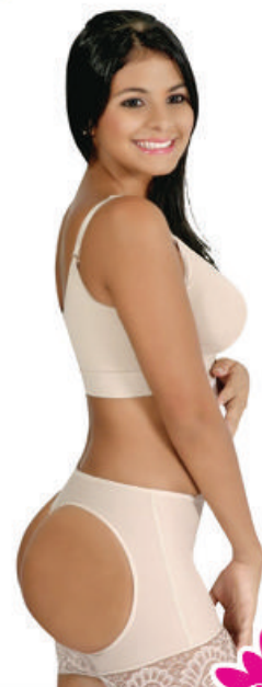
Levanta cola e/huecos